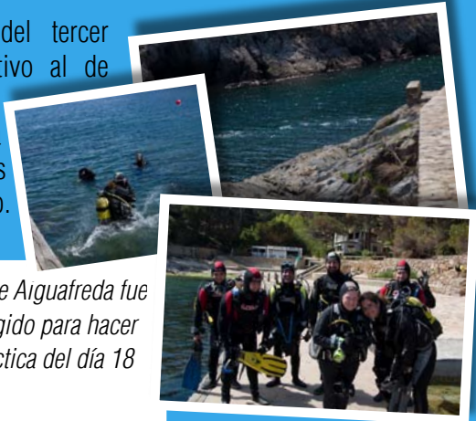
La estación de Arguafreda fue el lugar escogido para hacer la sesión práctica del día 18 de abril

La ejecución del tercer protocolo, relativo al de la inspección, está prevista para mediados de mes de mayo.